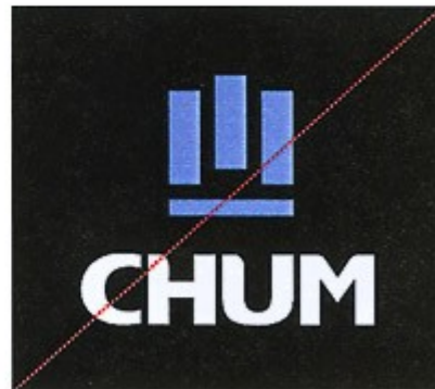
Combinaison des reproductions couleur et inversée