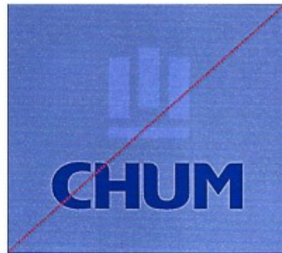
Reproduction en deux couleurs sur fond foncé