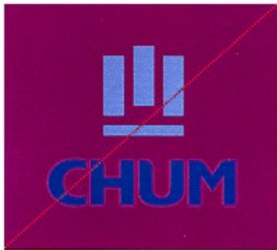
Reproduction en deux couleurs sur un fond créant une trop grande vibration visuelle