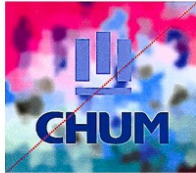
Reproduction en deux couleurs sur fond texturé nuisant à la lisibilité