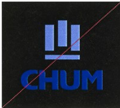
Reproduction en deux couleurs sur fond noir