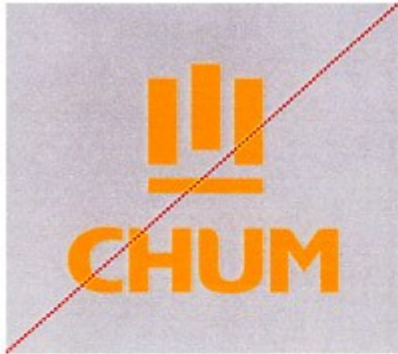
Reproduction monochrome d'une autre couleur que noir ou bleu PMS 301